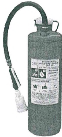
Рис. 6. Огнетушитель типа ОП-10