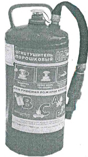
Рис. 7. Огнетушитель типа ОП-7Ф