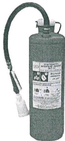
Рис. 6. Огнетушитель типа ОБП-10