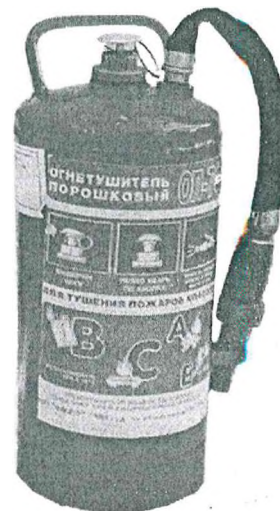
Рис. 7. Огнетушитель типа ОП-7Ф