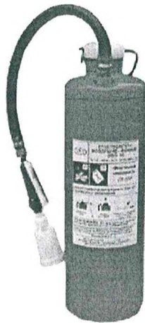
Рис. 6. Огнетушитель типа ОВП-10