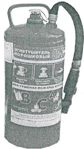
Рис. 7. Огнетушитель типа ОП-7Ф