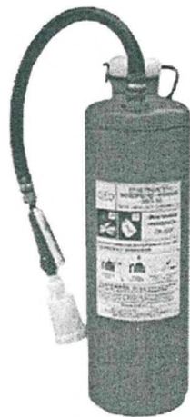
Рис. 6. Огнетушитель типа ОВП-10