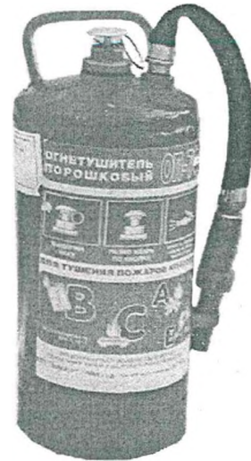
Рис. 7. Огнетушитель типа ОП-7Ф