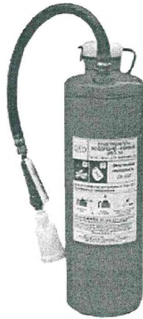
Рис. 6. Огнетушитель типа ОП-10