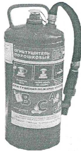
Рис. 7. Огнетушитель типа ОП-7Ф