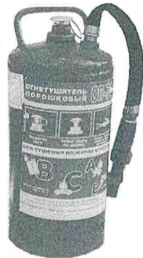
Рис. 7. Огнетушитель типа ОП-7Ф