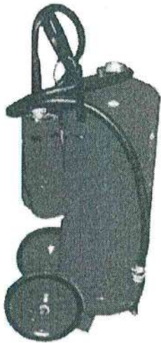
Рис. 5. Огнетушитель передвижной типа