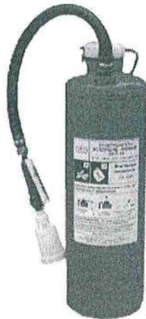
Рис. 6. Огнетушитель типа ОВП-10