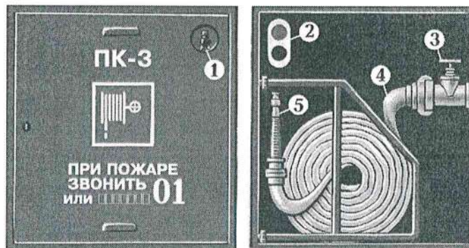
Рис. 10. Внутренний пожарный кран:

1 — место хранения ключа; 2 — пульт дистанционного включения насосоповысителя; 3 — пожарный кран; 4 — пожарный рукав; 5 — ствол