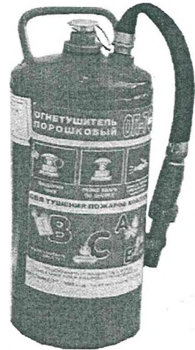
Рис. 7. Огнетушитель типа ОП-7Ф