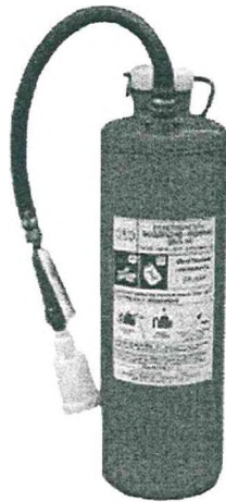
Рис. 6. Огнетушитель типа ОП-10