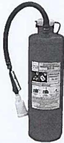
Рис. 6. Огнетушитель типа ОВП-10