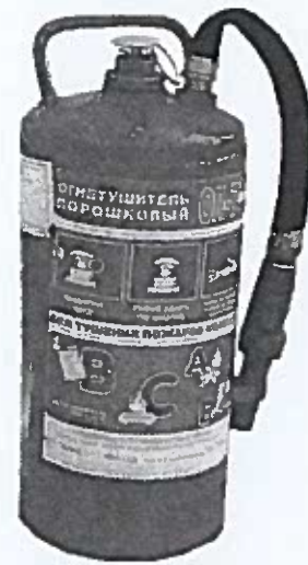
Рис. 7. Огнетушитель типа ОП-7Ф