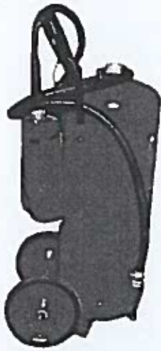
Рис. 5. Огнетушитель передвижной типа