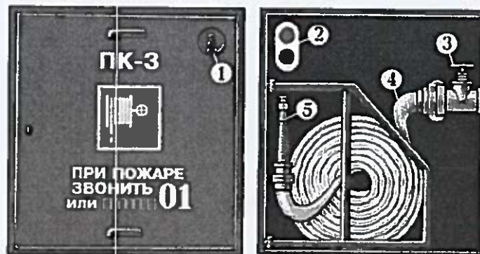
Рис. 10. Внутренний пожарный кран

1 — место хранения ключа; 2 — пульт дистанционного включения насоса-повысителя; 3 — пожарный кран; 4 — пожарный рукав; 5 — ствол